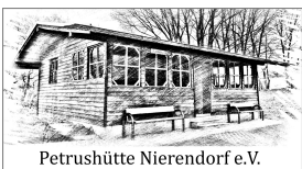
Petrushütte Nierendorf e.V.

St. Sebastianus-Bruderschaft Nierendorf 1725